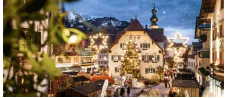
https://www.wolfgangseer-advent.at/de © Mirja Geh